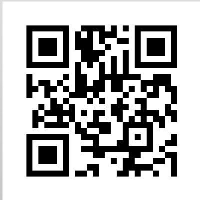
北科大創新育成中心