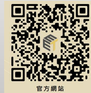
創新創業推動教育中心